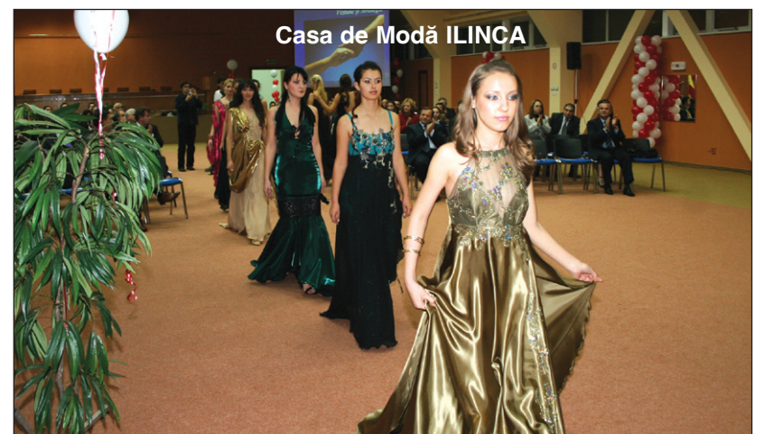
Casa de Modă ILINCA